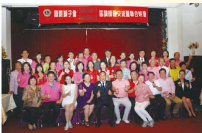
▲ A1與D1兩區總監暨講師團交流合影