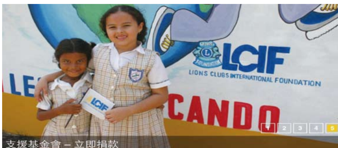
支援基金會 – 立即捐款