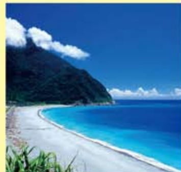
依山傍海 快意人生